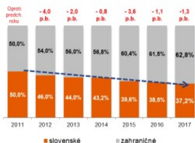
Báza N=360 predajní Pozn.: * p.b. = percentuálne body © GfK 2017 | Podiel slovenských potravín 2017 | Máj 2017